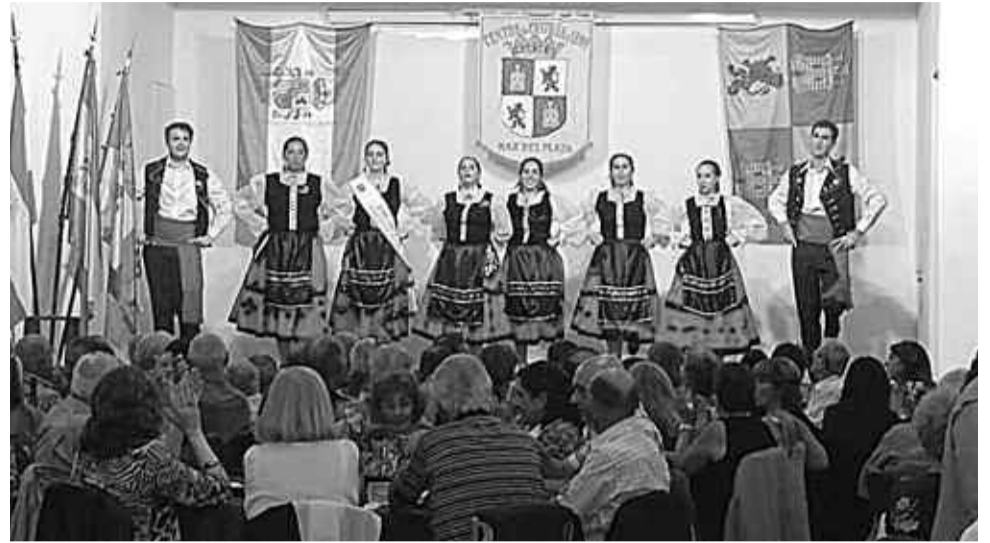
CENTRO DE CASTILLA Y LEÓN.

El Centro Gallego reunió a sus socios y sim-