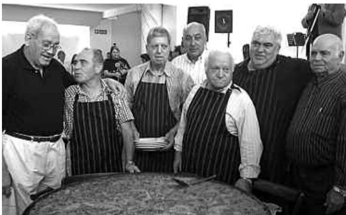
Los paelleros acompañados de directivos de la institución