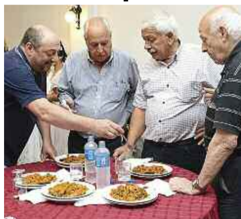
Integrantes del Jurado degustando las diferentes paellas realizadas por los concursantes.