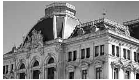
Sede del Gobierno del Principado.

También las personas emigrantes asturianas menores de sesenta y cinco años residentes en los lugares antes mencionados, siempre y cuando ostenten la condición de pensionistas por causas de invalidez, jubilación o viudedad y/o